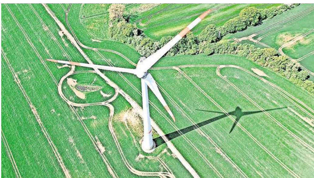
Erneuerbare Energie: Zwischen Nordgoltern, Landringhausen und Barrigsen soll ab Ende 2026 ein Windpark gebaut werden. Inbetriebnahme soll dann ein Jahr später sein.

Der Klimaschutzverein „Basche erneuerbar“ begrüßt die Windparkpläne. Damit sich die Politik hier deutlich zum Ausbau der Erneuerbaren in Barsinghausen bekannt. „Wir freuen uns darüber, dass auf einem auch aus