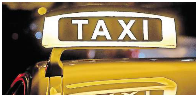
Für einen sicheren Heimweg: In Gehrden soll ein Frauennachttaxi eingeführt werden.

Diesem Vorschlag der Verwaltung hat der Rat am Mitt-