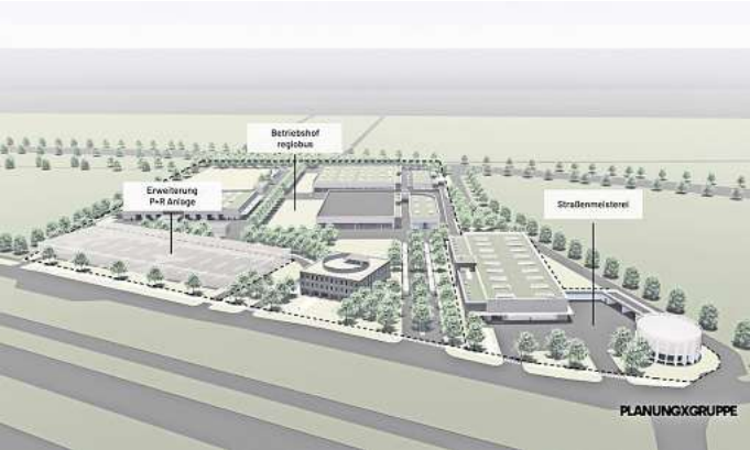
Neue Ansicht: So soll nach der Entwurfsplanung des Büros Planungsgruppe die Anordnung der Gebäude auf dem neuen Betriebshof der Regiobus aussehen.

Für den Bereich Sportplatz/Betriebshof/Bahnübergang versprach Baumgarten: „Es wird eine sichere Fuß- und Radwegquerung geben.“ Genauere Planungen dafür existieren aber ebenfalls noch nicht.