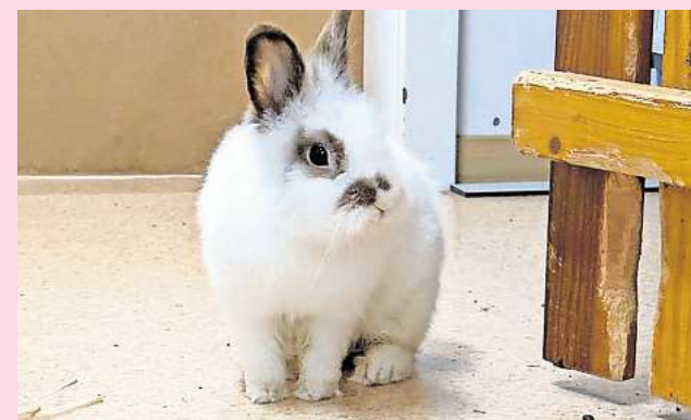
Auf Kontaktsuche: Der kleine Kaninchenbock Rudi.

Tierschutzverein Barsinghausen und Umgebung Ludwig-Jahn-Straße 11a 30890 Barsinghausen Telefon (05105) 7736777