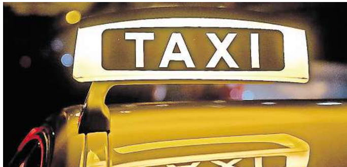
Für einen sicheren Heimweg: In Gehrden soll ein Frauennachttaxi eingeführt werden.

Diesem Vorschlag der Verwaltung hat der Rat am Mitt-