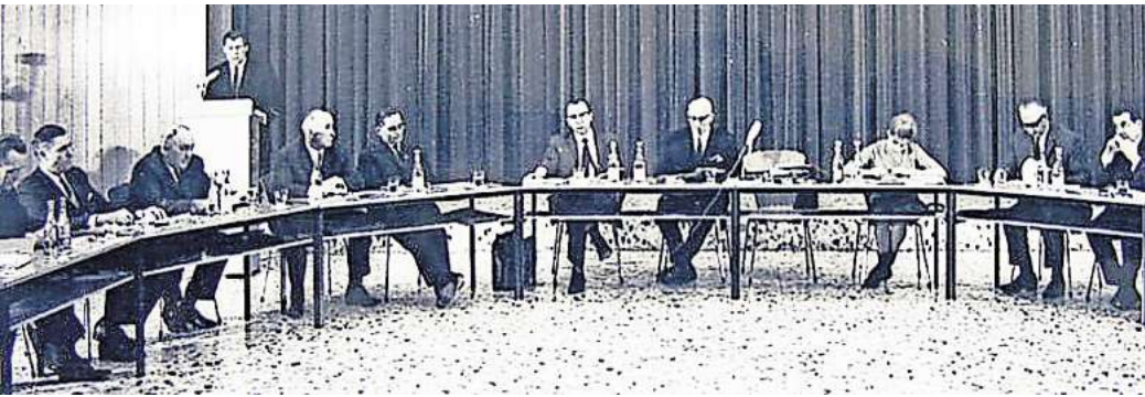
Wegweisende Versammlungen: Der Gemeinderat in Empelde traf sich zu seinen Beratungen in der Aula der Realschule.

Empelder Landespolitiker Hüper stellte Weichen zur Großgemeinde – und trickste damit Hannover aus