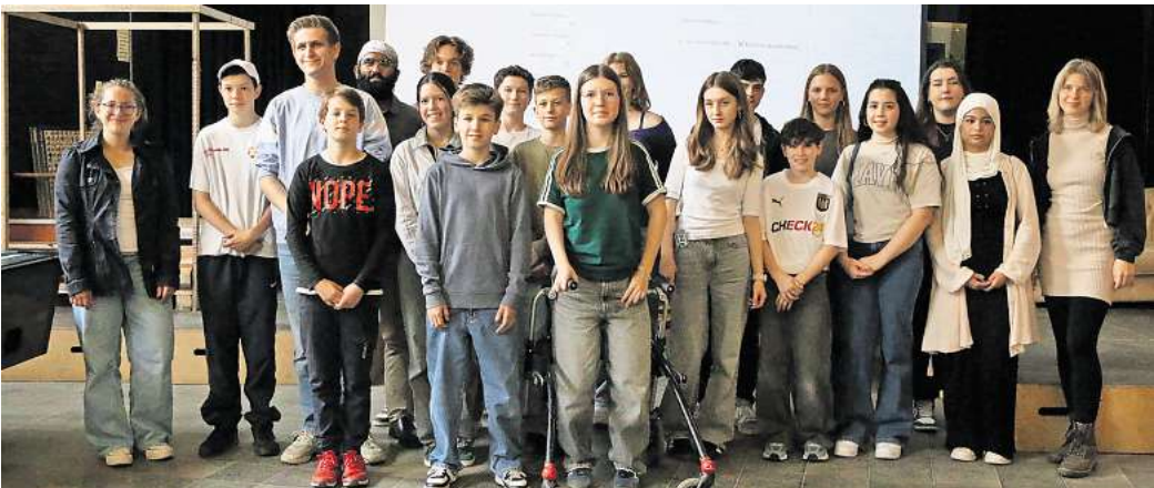
Neu gewählt: 15 Jungen und Mädchen gehören dem neuen Jugendparlament an.