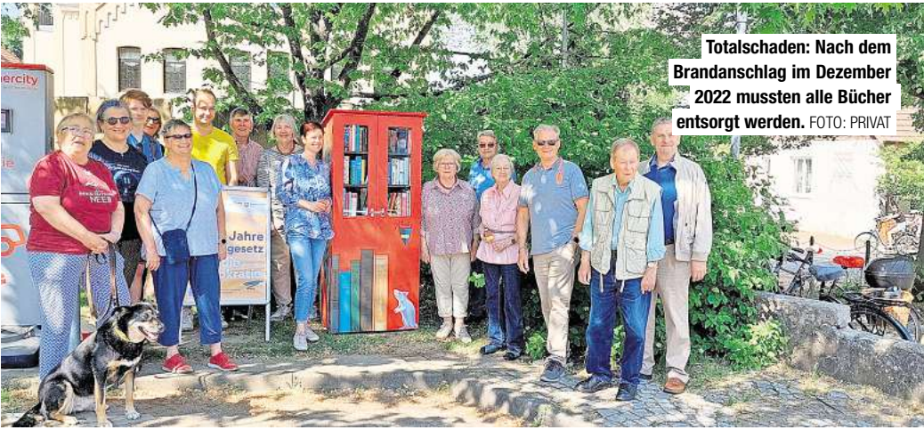
Totalschaden: Nach dem Brandanschlag im Dezember 2022 mussten alle Bücher entsorgt werden.

Die Stadt Ronnenberg feiert 55 Jahre „Ronnenberg-Gesetz“ am Sonnabend, 22. Juni, um 15 Uhr im Gemeinschaftshaus Ronnenberg mit einem Festakt. Geplant sind historische Fachvorträge und Beiträge des Feuerwehrmusikzuges Linderte, der auch vor 55 Jahren bei der Gründung der Großgemeinde aufgetreten ist.