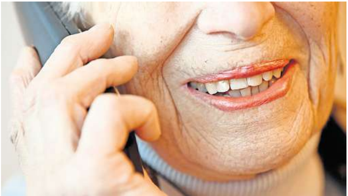
Mit dem „Silbertelefon“ bietet Silbernetz e.V. bundesweit täglich von 8 bis 22 Uhr ein Kommunikationsangebot für einsame ältere Menschen an.

Für Ältere hat dieses Problem aufgrund ihrer Lebensumstände besondere Dimensionen, denn genau diese Lebensumstände sind es, die einerseits zur Vereinigung Älterer führen können, andererseits dann wiederum Wege aus der Einsamkeit erschweren. „Das können Verluste und Trauer sein, Armut, Immobilität, Barrieren, Krankheit, Pflege, Informationsarmut, Wohnortwechsel“, sagt Schilling – und außerdem auch eine subtile Altersdiskriminierung, „die in unse-