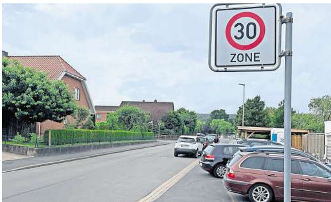
Ein Beispiel, wo bereits Tempo 30 gilt: An der Kreuzung Egestorfer Straße/Einsteinstraße in Kirchdorf steht ein Zone-30-Schild.

Barsinghausen. Der Bund hat eine Reform des Straßenverkehrsrechts beschlossen. Wichtigste Auswirkung: Künftig haben Städte und Gemeinden mehr Freiheiten, Tempo-30-Bereiche auf ihren Straßen einzurichten. Für Kommunen soll es künftig aber auch leichter werden, Zebrastreifen, Bus- oder Radspuren für Gemeindestraßen anzuordnen. In Barsinghausen stößt die Reform seitens der Kommunalpolitik auf viel Zustimmung. Es gibt schon erste Ideen, aber auch Kritik. Nur von der Verwaltung gibt es dazu keine Aussage. Über mögliche Umsetzungspläne oder Standorte hat sich die Stadt auf Nachfrage bislang nicht geäußert.