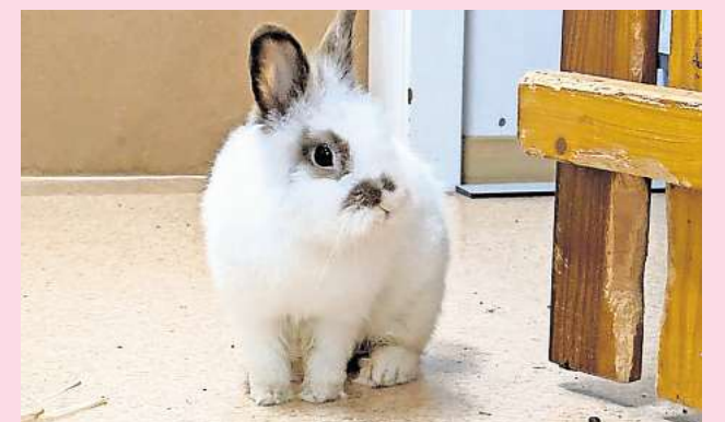
Auf Kontaktsuche: Der kleine Kaninchenbock Rudi.

Tierschutzverein Barsinghausen und Umgebung Ludwig-Jahn-Straße 11a 30890 Barsinghausen Telefon (05105) 7736777